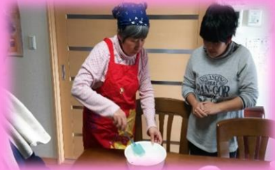
粉を、混ぜ、ませ、マゼ

からは、女性らしい?!一面をお届けします!。普段はスーパーなどで土日のおやつを購入していますが、月に1回、「おやつ作り」をしています。スーパーでは簡単に、パンやスナック菓子・チョコレートなどを購入できますが、この日は自分たちで作り、失敗したらどうなるのだろう…という心配を抱きながら挑戦です!以下、入居者の方々の奮闘ぶりです。