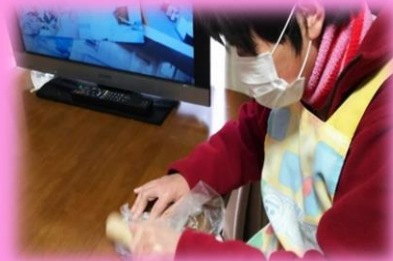
チョコをカいっばい砕いて、粉と一緒に日頃のストレスを・・・!